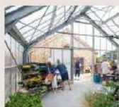
ACTION 1 : LA CEINTURE DORÉE

La trame apaisée synthétise les grandes orientations d'une vision paysagère et territoriale.