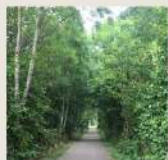
ACTION 3 : VALORISATION DES FRICHES