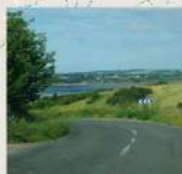
ACTION 5 : DES AXES STRUCTURANTS DE MOBILITÉ