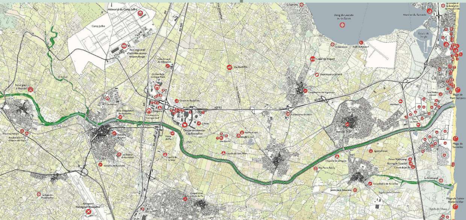
Les lieux emblématiques ou « pépites » de la vallée de l'Agly.

Au centre de la stratégie d'aménagement, un projet de parc agricole équipé vient compléter le schéma global déjà composé des zones d'activité économiques (ZAE) et des zones de tourisme de masse du littoral. Ce projet de parc agricole est un territoire d'entre-deux : entre mer et montagne, entre modernité et tradition. L'objectif est de permettre et d'accompagner de nouveaux développements culturels, touristiques et économiques par un nouveau réseau d'infrastructures de modes doux, tout en préservant les ressources existantes, culturelles, touristiques, économiques et naturelles. La mise en scène de ces ressources dans le paysage est au premier plan de cette démarche. À l'image de ce qui est en cours sur la vallée de la Têt qui traverse Perpignan ou à l'image du parc du Prato au coeur de la vallée de l'Arno en Italie, la stratégie élaborée à l'échelle de la vallée de l'Agly tend à organiser une mixité fonctionnelle au sein d'un parc agricole.