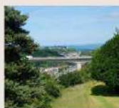
ACTION 4 : PLUI - PLAN PAYSAGE