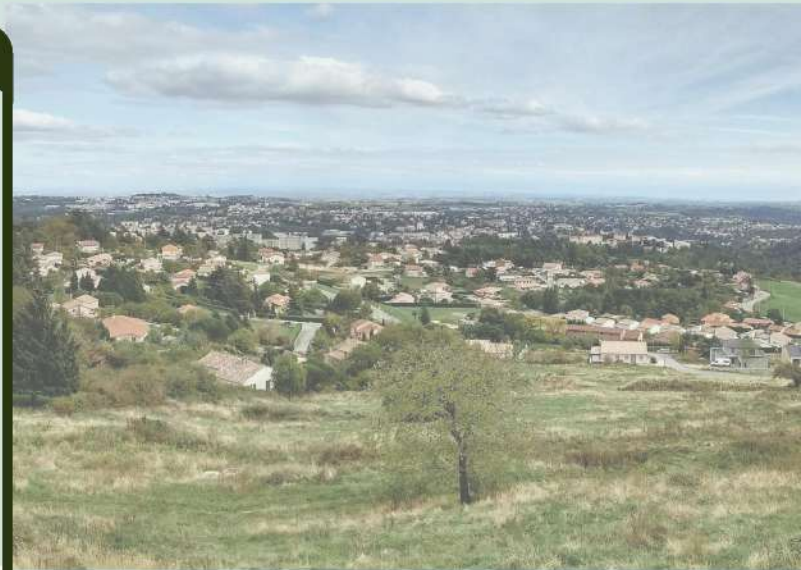
Davézieux/Annonay, un engrenage pour le moteur du territoire.

Caudex (paysagiste, mandataire) Germe & Jam (architecte) Alphaville (programmiste)