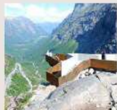
ACTION 2 : LE PARC DES VALLÉES